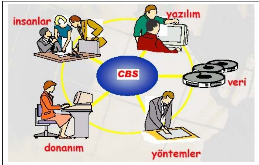
Şekil 1. Coğrafi Bilgi Sisteminin Bileşenleri

Grafik-Olmayan Bilgiler ise, genellikle grafik olmayan tanımlayıcı nitelikteki yazılı bilgiler olup, coğrafi varlıkların, öznelik bilgilerinden oluşur.