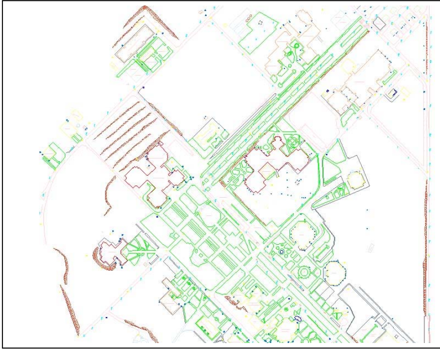
Şekil 3. Test alanı

Uygulama alanı olarak, Selçuk Üniversitesi Alaeddin Keykubat Kampusu seçilmiştir. Kampus alanı Konya şehir merkezine yaklaşık 20 km. uzaklıkta olup Konya-Afyon karayolu üzerindedir. Kampus alanında yapılaşma kısmen tamamlanmış, çevre düzenleme çalışmaları ise devam etmektedir. Çalışma alanı olarak, CBS oluşturulması için gerekli olan konumsal verilerin elde edilmesi ve karşılaştırmalarının yapılabilmesi için yaklaşık 20 hektarlık bir test alanı seçilmiştir ( Şekil 3).